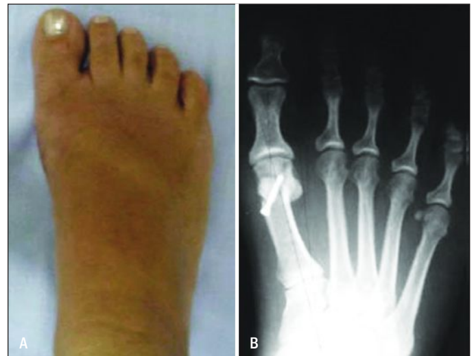
Figura 2 - Mesma paciente da Figura 1, no 6º mês de pós-operatório, com metatarsofalângico de 10° e intermetatarsiano de 6°.

Os pacientes foram posicionados em decúbito dorsal horizontal, sob anestesia raquidiana e o garroteamento na base da coxa com faixa de Esmarch. Realizou-se incisão medial de aproximadamente 4 a 6cm, na topografia da articulação MF do hálux na transição da pele dorsal com a plantar, protegendo o nervo digital dorsal. A cápsula foi aberta em "L" invertido, dissecada até a eminência medial do primeiro metatarsiano. Procedeu-se à exostectomia, respeitando o limite medial ao sulco sagital, utilizando osteótomo reto e martelo. Marcou-se, então, o corte no centro da cabeça e demarcaram-se os braços da osteotomia em "V", de ápice distal, com aproximadamente 60° entre eles. A serra utilizada foi a oscilatória a nitrogênio. Após, realizou-se o translocamento sagital lateral da cabeça do metatarsiano, cuidando para não translocar mais do que a metade do diâmetro da cabeça. Uma impacção no sentido axial do primeiro metatarsiano foi realizada para estabilizar a osteotomia, e o excesso de osso metafiso-diafisário resultante do translocamento da cabeça foi ressecado. A fixação da osteotomia foi feita com parafuso de microfragmentos de 2,0mm de diâmetro (Figuras 2A e 2B).