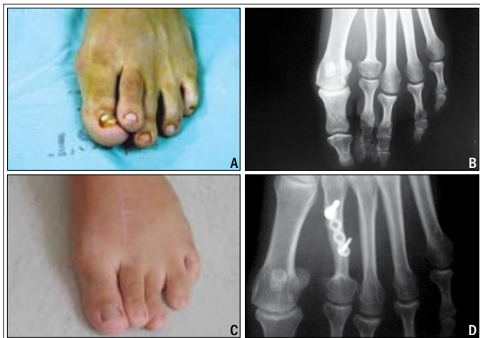
Figura 3 - Técnica utilizando enxerto ósseo autólogo de tíbia. A) Pré-operatório do 2º dedo encurtado e supra-aduto, pé esquerdo. B) Radiografia pré-operatória mostrando o 2º metatarso curto. C) Aspecto pós-operatório. D) Radiografia pós-operatório mostrando o 2º metatarso alongado e fixado com placa de mini-fragmentos.