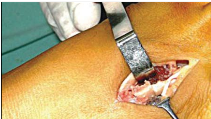
Figura 5 - Alongamento do metatarso com interposição do enxerto ósseo da tíbia colocado.

O resultado insatisfatório ocorreu com a paciente 01D (Tabela 2) na qual o alongamento obtido foi de apenas cinco mm, metade do desejado para este metatarso.