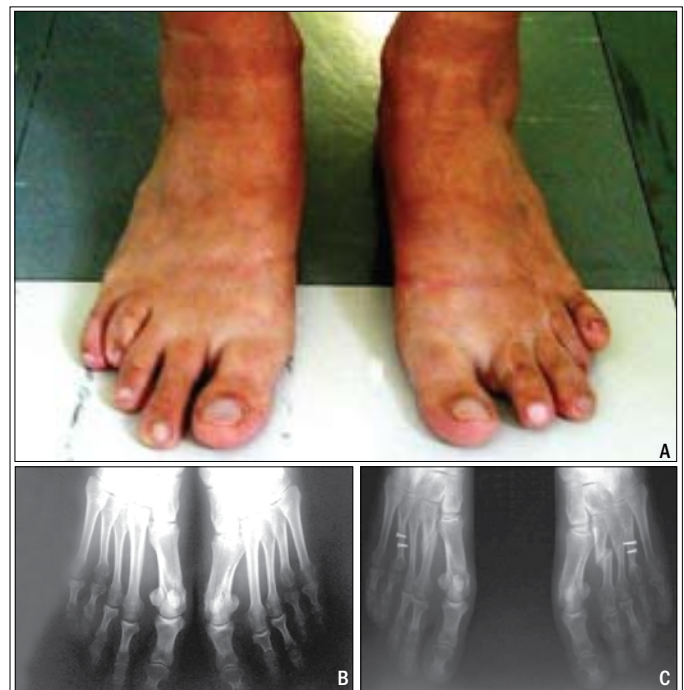
Figura 1 - Técnica utilizando alongamento em "Z" do 4º metatarso curto bilateral. A) Pré-operatório do 4º dedo encurtado em ambos os pés. B) Radiografia pré-operatória mostrando o quarto metatarso curto em ambos os pés. C) Radiografia do pós operatório, mostrando o alongamento dos 4ºs e encurtamento dos 2ºs metatarsos, mediante osteotomias.

O porcentual de alongamento foi calculado levando-se em conta, o tamanho inicial do metatarso e o tamanho obtido após o ato operatório, tendo como aumento médio no pós-operatório 8,43 mm, com mínimo de cinco e máximo de 10 mm.