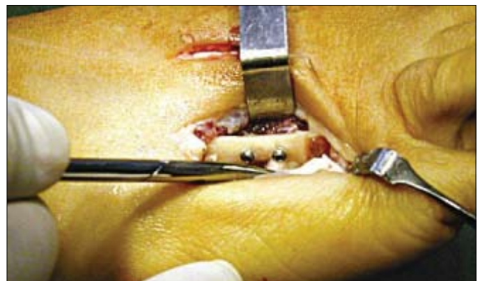
Figura 2 - Alongamento em "Z" do metatarso, fixado com dois parafusos de mini-fragmentos.