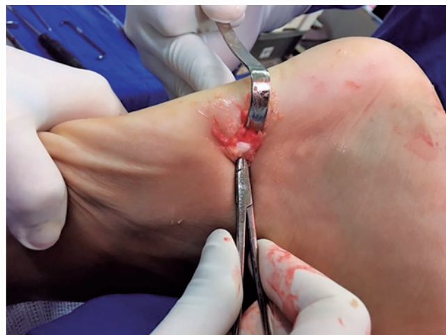
Figura 3 | Identificação do trajeto do tubular curto.