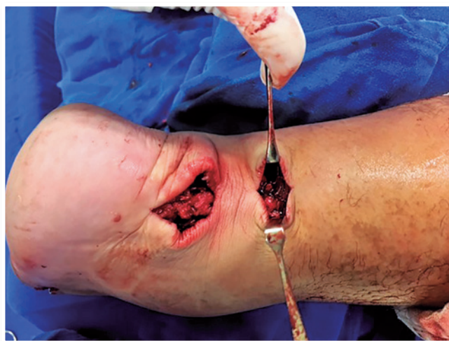
Figura 4 | Sutura do tendão de Aquiles com o tendão fibular curto.