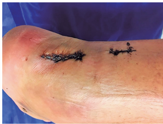
Figura 5 | Aspecto clínico final.

Uma bota gessada bem acolchoada foi aplicada no pós-operatório com quinze graus de equino, tendo sido trocada após três semanas para órtese (robofoot/walkerboot), momento em que foi liberada a marcha com muletas. A ferida operatória foi avaliada semanalmente. Na quarta semana pós-operatória foi iniciada fisioterapia com exercícios isométricos para panturrilha. Na sexta semana, ocorreu liberação da imobilização e manutenção da fisioterapia para fortalecimento e propriocepção por dois meses.