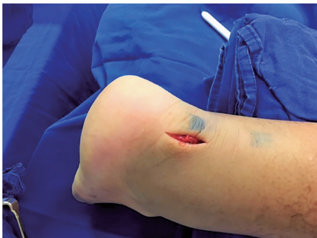
Figura 2 | Incisão sob o coto distal do tendão de Aquiles.