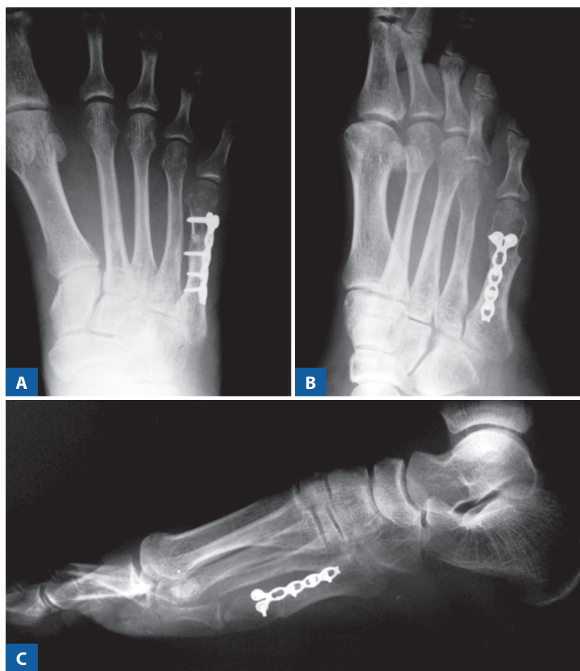
Figura 4 | Radiografias do pós-operatório tardio de osteotomia consolidada e ausência de recidiva.