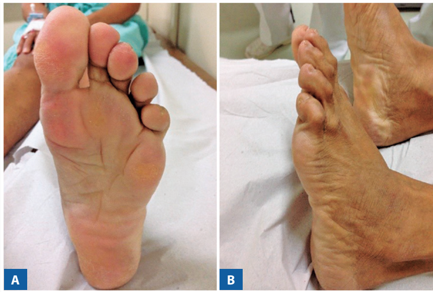
Figura 1 | Exame físico pré-operatório.

A paciente teve alta em 24 horas com tala gessada em modelo bota, sem apoio, o retorno ambulatorial ocorreu após uma semana para colocação de sandália em modelo Barouk. Os pontos foram retirados em três semanas e, na sexta semana, após serem realizadas radiografias de controle confirmando a consolidação da osteotomia (Figura 4A, B e C), foi liberada carga. Com doze meses a pacien-