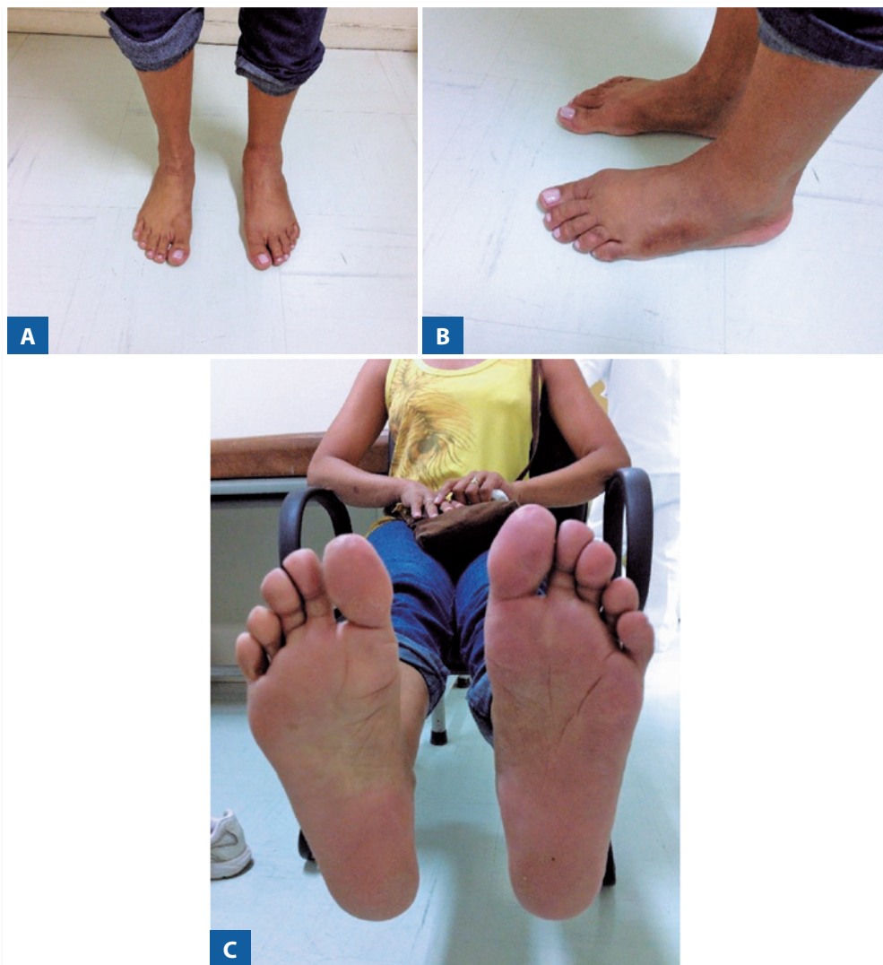
Figura 5 | Pós-operatório com correção das deformidades e calosidades.

As coalizões ósseas congênitas no pé são relativamente incomuns, presentes em 1-2% da população. Contudo, uma vez que na maioria das pessoas manifesta-se de forma assintomática, a verdadeira prevalência é provavelmente maior (4,8) . As barras mais comuns e extensamente descritas na literatura ocorrem entre os ossos do tarso, tipicamente em crianças, sendo a calcaneonavicular e talocalcaneana as mais comuns que corresponde a mais de 90% dos casos (1,3,6,8) . Outras menos comuns incluem calcaneocuboide, naviculocuneiforme, cuboidenavicular (2) e metatarsocuboide (9) . As coalizões intermetatarsais são raras, assim há poucos